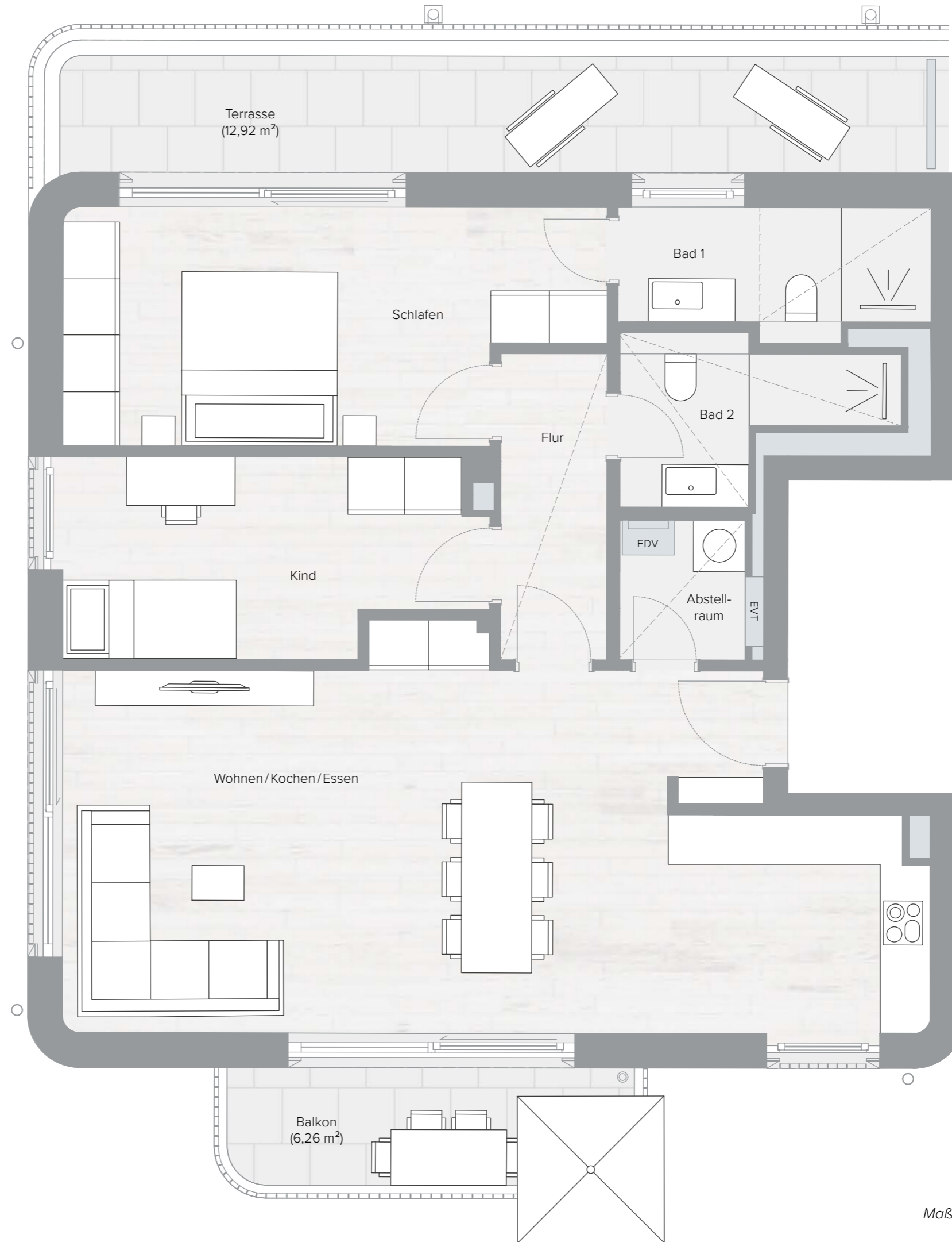
HAUS B | 1. OG